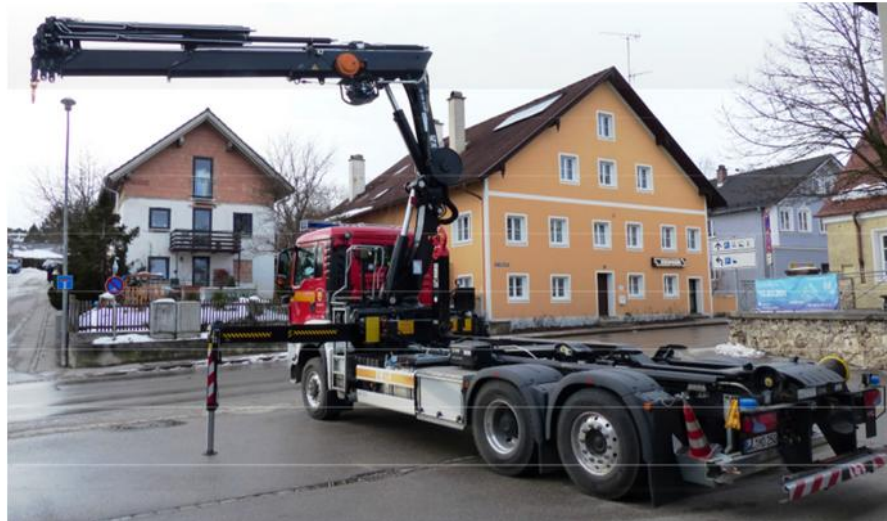
Kran im Seilwinden Betrieb